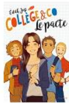
Collège and Co Edith Jast Ed. Mame