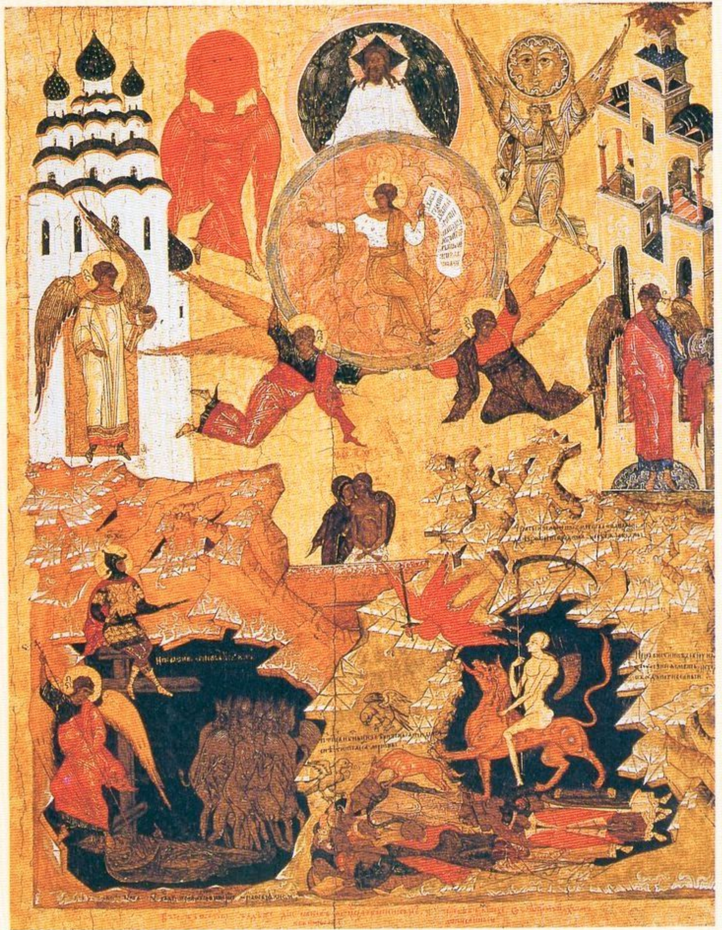
Icône russe du 16eme siècle, illustrant à la fois l'apocalypse et le prologue de l'évangile selon saint Jean.