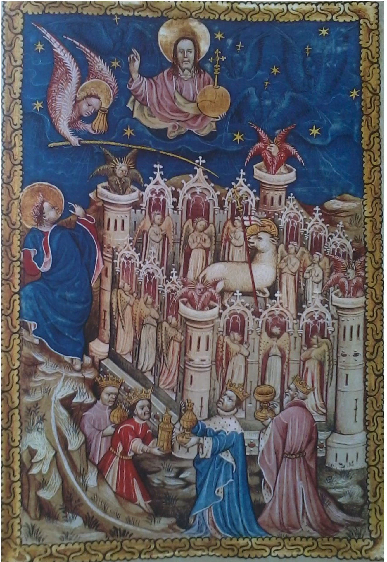
Enluminure, probablement 1400-1410

Illustre le chapitre 21 : le défi est de faire rentrer dans une image la totalité du chapitre ! D'où l'effet un peu surchargé.