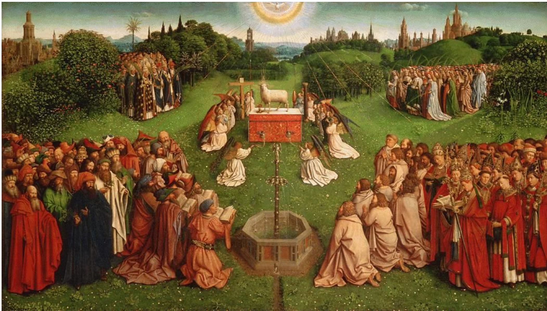
L'agneau mystique des frères Hubert et Jan Van Eyck, inauguré le 6 mai 1432 dans la cathédrale de Gand. C'est le premier retable en bois peint de cette taille, et de cette précision. Il illustre l'adoration de l'agneau qu'on retrouve plusieurs fois dans l'apocalypse. Pour montrer que cette adoration est universelle, des groupes de personnes affluent de toute part pour adorer l'agneau.