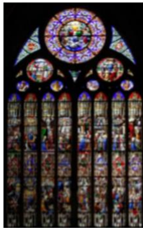
▲ Grande verrière Sud, cycle de la Vierge

de Pierre et Paul, les archanges, les docteur de l'Eglise, la vie de certains donateurs, ainsi que les grands lieux contemporains de pèlerinage dédiés à la Vierge. La richesse et l'unicité de ces véritables murs de verre ont valu à l'église le qualificatif de « sainte chapelle balnéaire ».