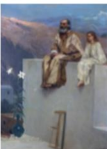
▲ Saint Joseph père nourricier du Christ, J.-J. Benjamin-Constant

Fondation du Patrimoine 6 bis rue Saint Nicolas 14000 Caen