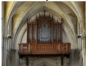
▲ Orgue Mutin Cavallé Coll

Le buffet d'orgue, installé en 1920, occupe toute l'ouverture de la tribune. Il est signé des ateliers MUTIN-CAVAILLÉ-COLL et offre 37 tuyaux de montre. Un tableau de