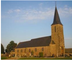
Eglise de Carville