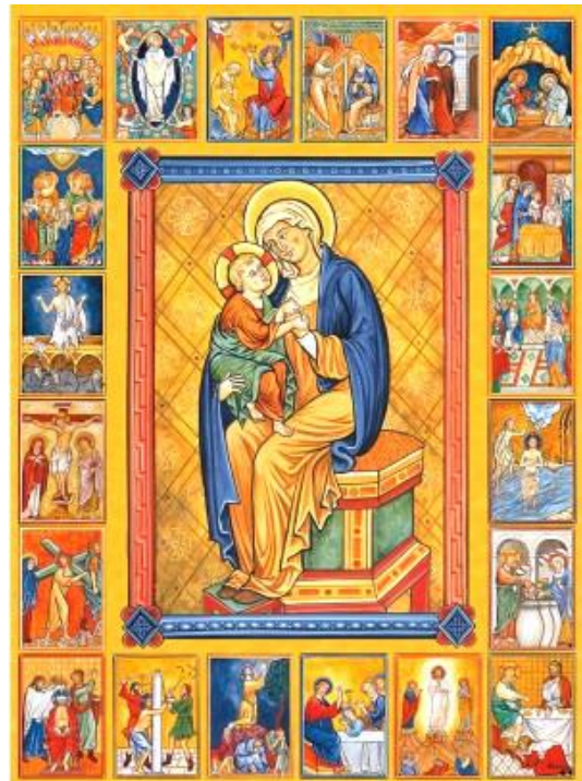
Îcône des 20 mystères du rosaire

En disant les je vous salue Marie , on médite sur les mystères joyeux (Annonciation, Visitation, Nativité, Présentation de Jésus au Temple, Jésus retrouvé au Temple), les mystères douloureux (Agonie de Jésus, Flagellation, Couronnement d'épines, Portement de la Croix, Crucifixion de Jésus), les mystères glorieux (Résurrection, Ascension, Pentecôte, Assomption, Couronnement de la Vierge), et les mystères lumineux (Baptême du Seigneur, Noces de Cana, Proclamation du Royaume, Transfiguration, Institution de l'Eucharistie). Les mystères lumineux ont été ajoutés par saint Jean-Paul II en 2002 et, pour lui, l'objectif du rosaire est de « contempler avec Marie le visage du Christ ».