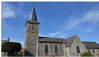
Eglise de St Denis-Maisoncelles