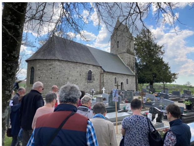
Le chemin de croix à Malloué