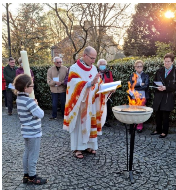
Vigile pascale, bénédiction du feu nouveau