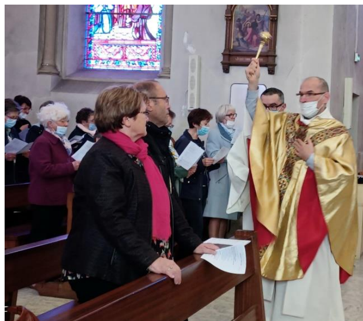
Le dimanche de Pâques, Christ est ressuscité !