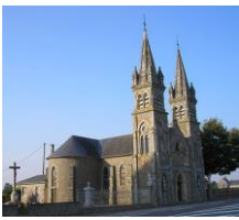
Chapelle N-D du Bocage