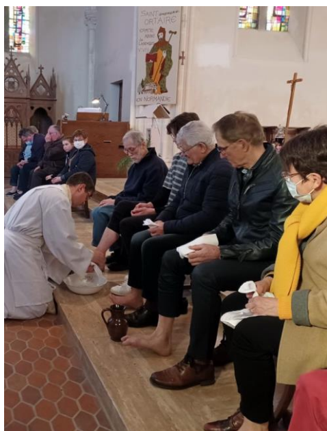
Le lavement des pieds, le Jeudi saint